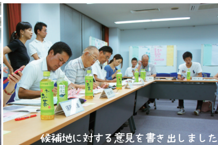
候補地に対する意見を書き出しました