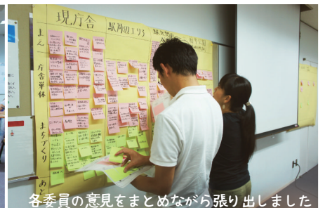
各委員の意見をまとめながら張り出しました