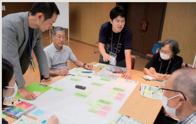
▲第2回ワークショップの様子

最初に第1回市民ワークショップのまとめを共有した後に、「新庁舎に期待すること」を付箋に書いていただきました。その結果、窓口対応や相談機能の充実に関することや市職員の職場環境の向上に関すること、災害時の拠点として対応や情報提供を行うことや連絡所の機能強化に関することなどの意見をはじめ、「機能を1カ所に集中する⇔機能を分散する」や「まちのシンボルとする⇔建設費用を抑えた庁舎とする」、「交流の場とする⇔コンパクトに小さくする」などの相反する意見が挙がりました。